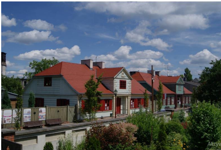
Park Kulturowy Miasto Tkaczy - ul. ks. Sz. Rembowskiego